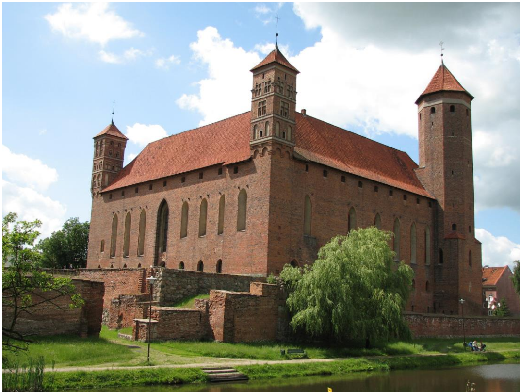
Lidzbark Warmiński, Zamek Biskupów Warmińskich

Załącznik do Uchwały Nr OR.0710.32.2021 Rady Powiatu Lidzbarskiego z dnia 16 grudnia 2021 r.